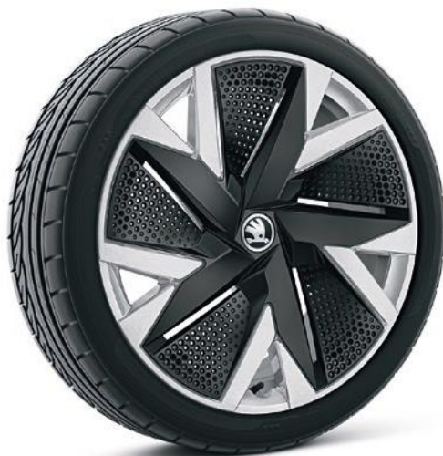
Cerchi in lega leggera 19" «Aniara» argento con copricerchi Aero neri