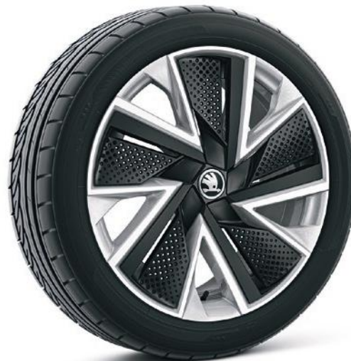
Cerchi in lega leggera 18" «Bosona» argento con copricerchi Aero neri