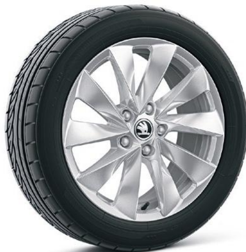
Cerchi in lega leggera 17" «Mintaka» argento