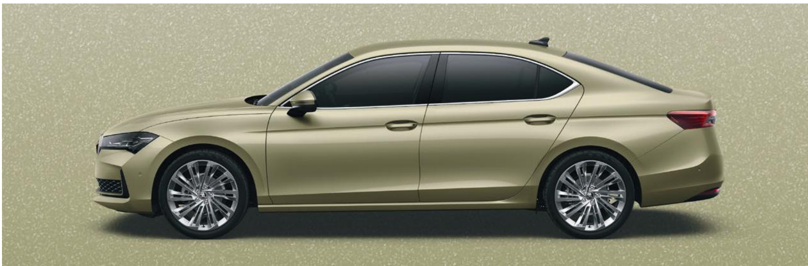
Giallo Ice Tea, metallizzato

Il modello illustrato (berlina) non è disponibile sul mercato svizzero. Le figure sono finalizzate solo all'illustrazione dei colori per il modello station wagon. I colori raffigurati possono differire dai colori effettivi della vernice in funzione della sua qualità.