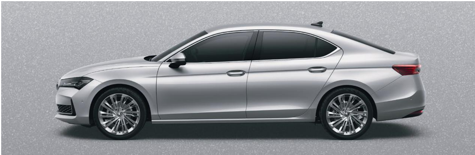
Argento Pebble, metallizzato