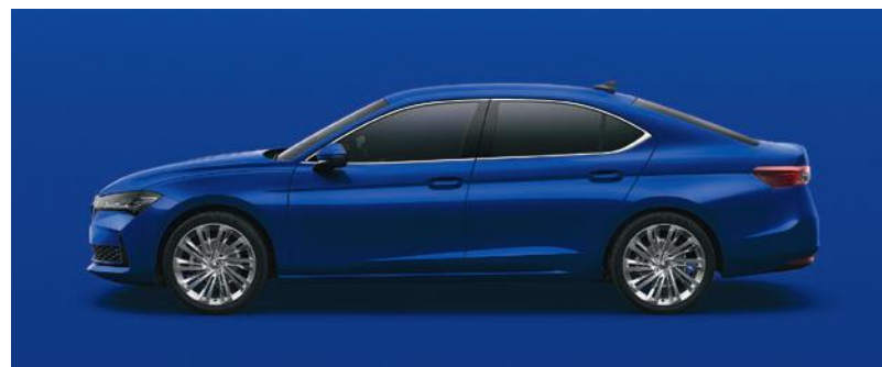
Blu Energy, tinta unita