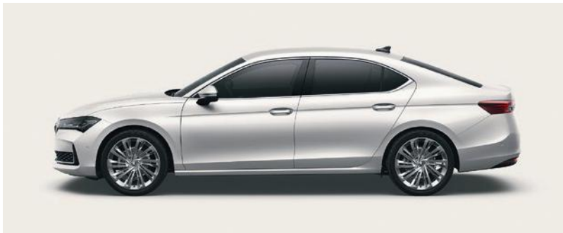
Bianco Purity, tinta unita