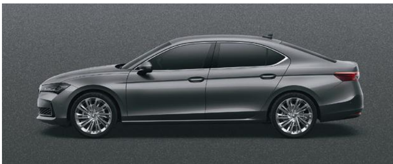
Grigio grafite, metallizzato