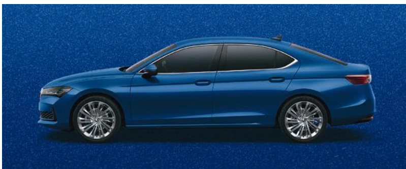
Blu cobalto, metallizzato