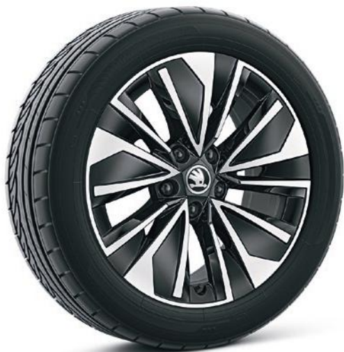
Cerchi in lega leggera 17" «Alrakis» argento