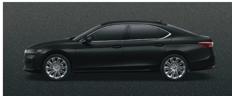
Nero Ebony, metallizzato

Il modello illustrato (berlina) non è disponibile sul mercato svizzero. Le figure sono finalizzate solo all'illustrazione dei colori per il modello station wagon. I colori raffigurati possono differire dai colori effettivi della vernice in funzione della sua qualità.