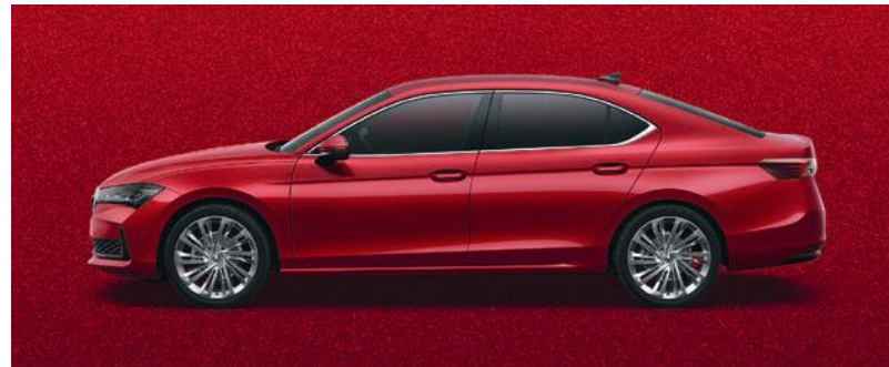
Rosso carmine, metallizzato