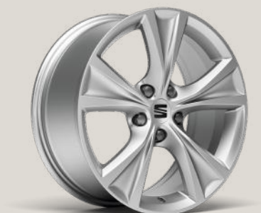
DYNAMISCHE LEICHTMETALLRÄDER 17" FR