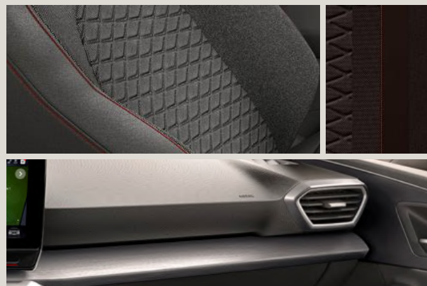
KOMFORTSITZE AUS STOFF