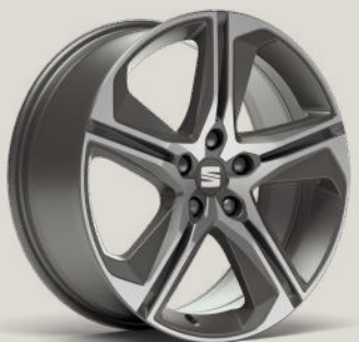
PERFORMANCE 18" 30/9 GEFRÄSTE LEICHTMETALLRÄDER IN COSMO GREY FR