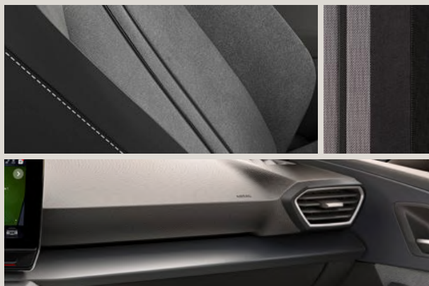
KOMFORTSITZE AUS STOFF