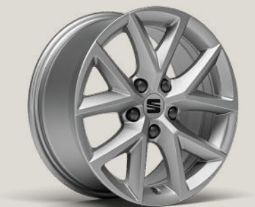
LEICHTMETALLRÄDER 16" FÜR DIE STADT ST