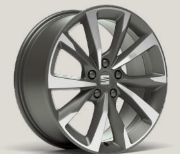
PERFORMANCE 18" 30/6 GEFRÄSTE LEICHTMETALLRÄDER IN COSMO GREY FR