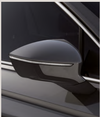
URANO GREY 1,4