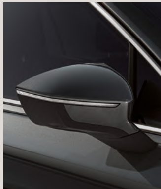
CAMOUFLAGE GREEN 3,4