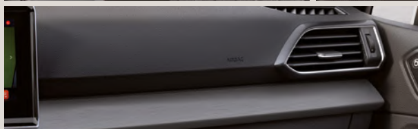
REVÊTEMENTS DE SIÈGE EN ALCANTARA / TISSU «NOIR/GRIS»