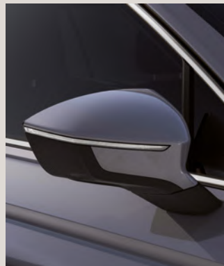
DOLPHIN GREY 2,4