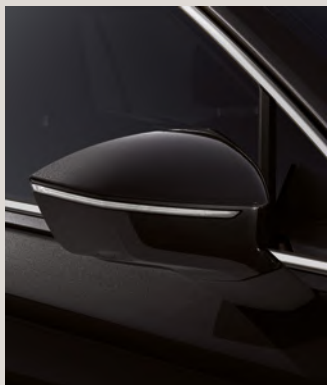
DEEP BLACK 2,4