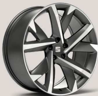
JANTES ALU 8.5J X 20" «SUPREME» 37/3