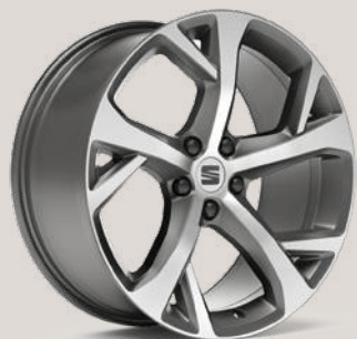
JANTES ALU 8.5J X 19" «EXCLUSIVE» 37/1