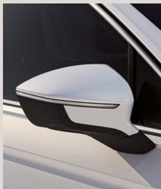
ORYX WHITE 3,4