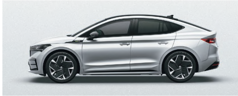
MOON WEISS, METALLIC