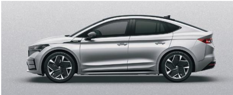
BRILLIANT SILBER, METALLIC