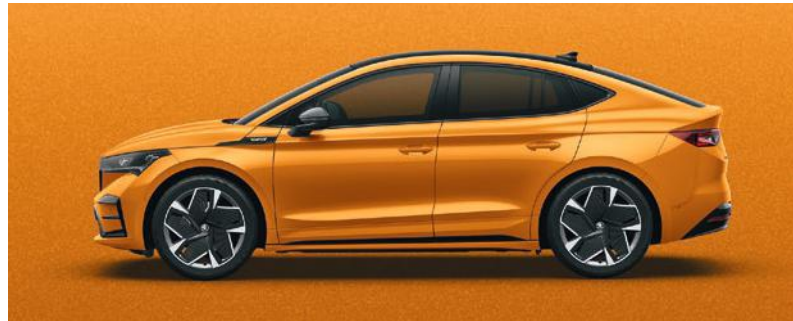
PHOENIX ORANGE, METALLIC