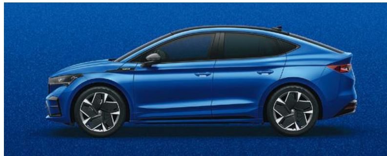
RACE BLAU, METALLIC