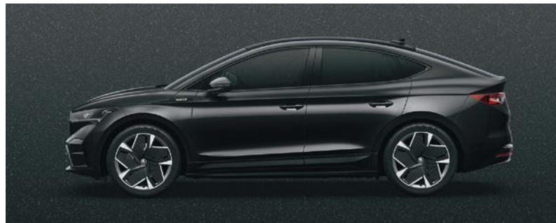
MAGIC SCHWARZ, METALLIC

Die dargestellten Farben können von den tatsächlichen Farben und Lackbeschaffenheiten abweichen.