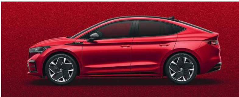
VELVET ROT, METALLIC