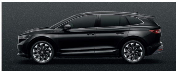
Perleffekt Schwarz Magic