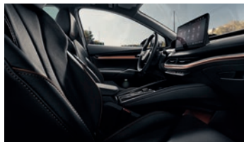
L&amp;K Suite schwarz