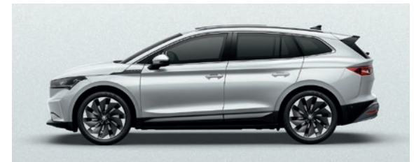
Metallic Moon Weiss