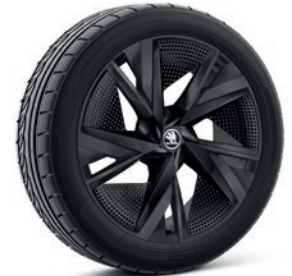
Leichtmetallrädern 8,0 J x 20" & 9,0 J x 20" «Taurus», schwarz