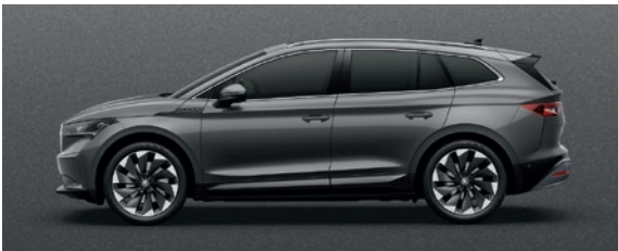
Metallic Graphite Grau