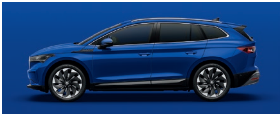
Uni Energy Blau