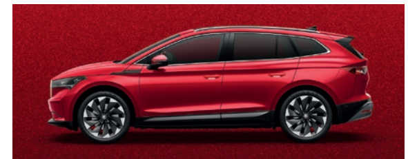
Metallic Velvet Rot

Die Preise verstehen sich in CHF inkl. 8.1% MwSt. Einige der oben aufgeführten Mehrausstattungen können nur in Verbindung mit zusätzlichen Mehrausstattungen bestellt werden. Zudem sind nicht alle aufgeführten Mehrausstattungen miteinander kombinierbar. Für detailliertere Informationen kontaktieren Sie bitte Ihren Škoda Partner.