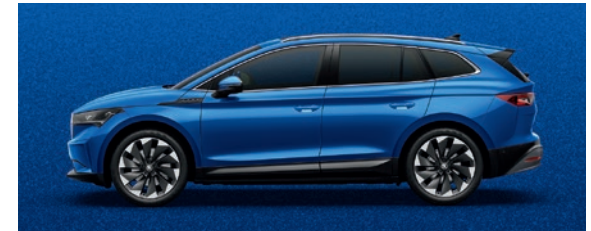
Metallic Race Blau