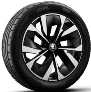
Leichtmetallrädern 7,0 J x 18" «Miran», schwarz mit polierter Oberfläche