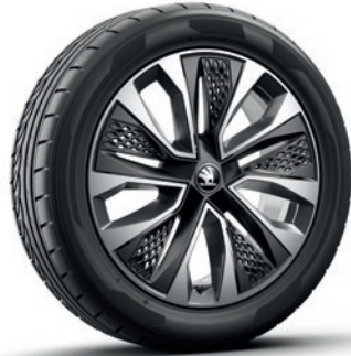
Leichtmetallrädern 7,0 J x 18" «Procyon», silber mit Aero Kappe, schwarz