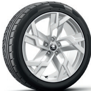
Leichtmetallrädern 8,0 J x 19" «Sagitarus», anthrazit mit polierter Oberfläche

Die Preise verstehen sich in CHF inkl. 8.1% MwSt. Einige der oben aufgeführten Mehrausstattungen können nur in Verbindung mit zusätzlichen Mehrausstattungen bestellt werden. Zudem sind nicht alle aufgeführten Mehrausstattungen miteinander kombinierbar. Für detailliertere Informationen kontaktieren Sie bitte Ihren Škoda Partner.