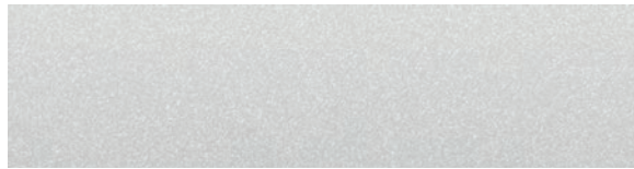
Metallic Brilliant Silber