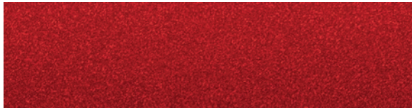
Metallic Velvet Rot