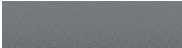
Metallic Graphite Grau