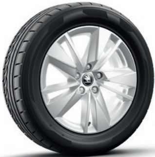
Leichtmetallrädern 7,0 J x 17" «Scutus», silber mit Aero Kappe, schwarz matt