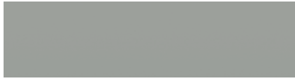
Spezial Steel Grau