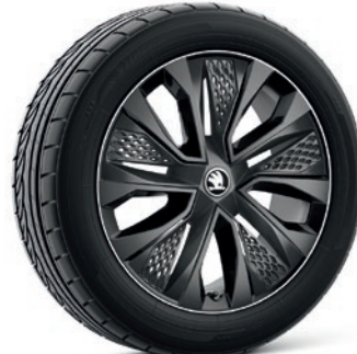
Leichtmetallrädern 7,0 J x 18" «Procyon», schwarz mit Aero Kappe, schwarz matt