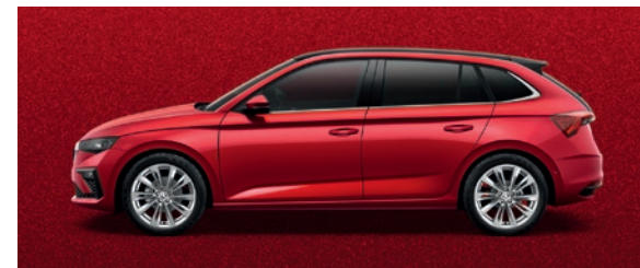
Metallic Velvet Rot

Die Preise verstehen sich in CHF inkl. 8.1% MwSt. Einige der oben aufgeführten Mehrausstattungen können nur in Verbindung mit zusätzlichen Mehrausstattungen bestellt werden. Zudem sind nicht alle aufgeführten Mehrausstattungen miteinander kombinierbar. Für detailliertere Informationen kontaktieren Sie bitte Ihren Škoda Partner.