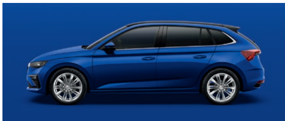
Uni Energy Blau