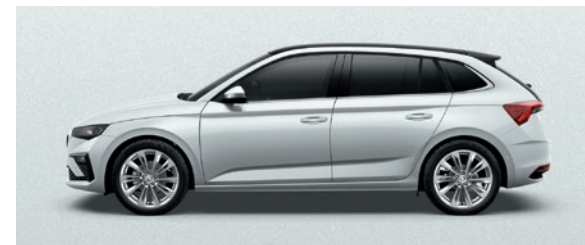
Metallic Moon Weiss