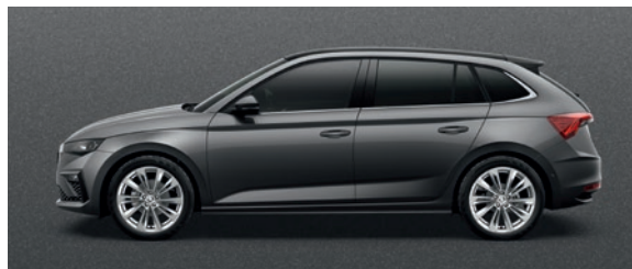
Metallic Graphite Grau