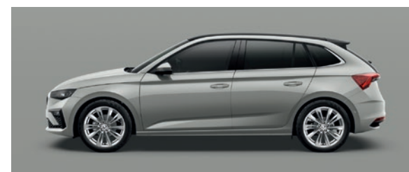
Uni Steel Grau