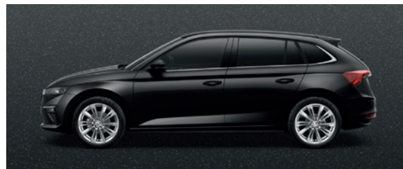
Perleffekt Schwarz Magic