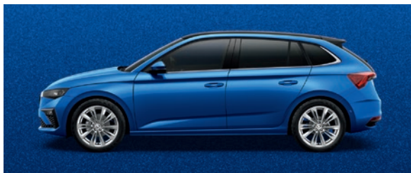
Metallic Race Blau