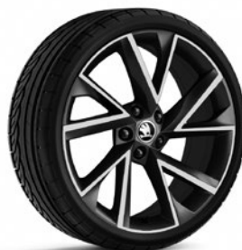
Leichtmetallräder 8,0 J x 19" «Vega» (Serie bei Sportline, Pneu 235/40 R19), anthrazit mit polierter Oberfläche