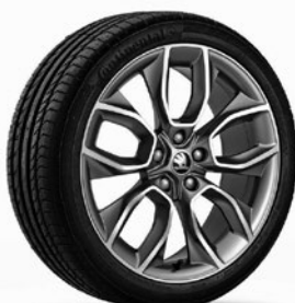
Leichtmetallräder 8,0 J x 19" «Manaslu» (Option für Scout, Pneu 235/40 R19), anthrazit mit polierter Oberfläche