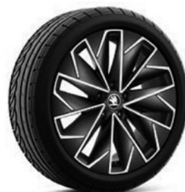
Leichtmetallräder 8,0 J x 18" «Propus Aero» (Serie bei L&K, Pneu 235/45 R18), schwarz mit polierter Oberfläche