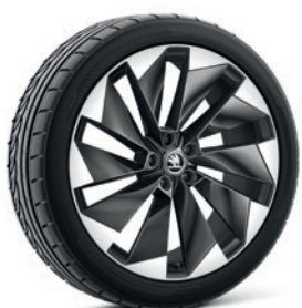
Jantes en alliage léger 8,5 J x 21" & 9,0 J x 21" «Supernova», anthracite