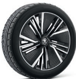
Jantes en alliage léger 8,0 J x 20" & 9,0 J x 20" «Neptune», anthracite