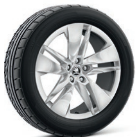
Jantes en alliage léger 8,0 J x 19" «Proteus», laqué argent