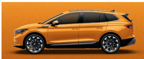
Métallisée Phoenix Orange