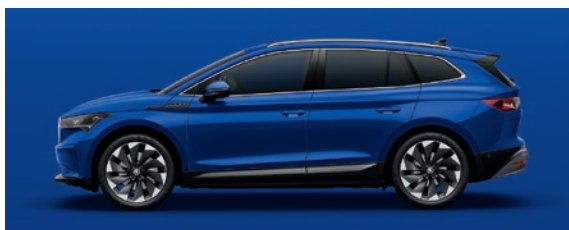
Uni Bleu Energy