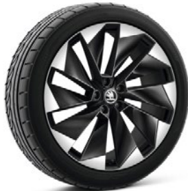
Jantes en alliage léger 8,5 J x 21" & 9,0 J x 21" «Supernova Sportline», noire