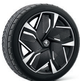
Jantes en alliage léger 8,0 J x 20" & 9,0 J x 20" «Vision RS», anthracite