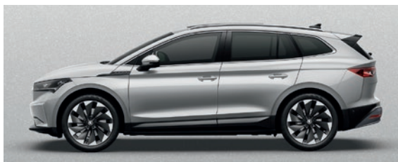
Métallisée Argent Brilliant