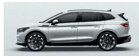
Métallisée Blanc Moon