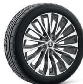
Jantes en alliage léger 8,0 J x 20" & 9,0 J x 20" «Asterion», anthracite