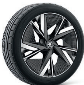
Jantes en alliage léger 8,0 J x 20" & 9,0 J x 20" «Taurus», anthracite