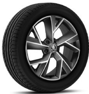
Jantes en alliage léger 7,0 J x 19" «Triglav» anthracite avec surface polie (Série pour Sportline, pneus 235/50 R19)