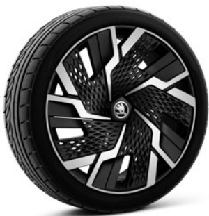
Jantes en alliage léger 8,0 J x 20" «Sagittarius» anthracite avec surface polie et couvercle Aero (Série pour RS, pneus 235/45 R20)