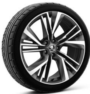
Jantes en alliage léger 8,5 J x 20" «Ignite» anthracite avec surface polie (RDKS) (Option pour RS, pneus 255/40 R20)