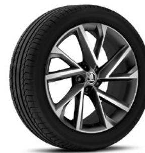
Jantes en alliage léger 8,0 J x 20" «Vega» anthracite avec surface polie (Option pour Sportline, pneus 235/45 R20)