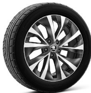
Jantes en alliage léger 7,5 J x 18" «Askella» anthracite (Option pour Ambition et Style, pneus 235/55 R18)