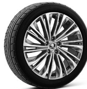
Jantes en alliage léger 7,5 J x 19" «Cursa» anthracite avec surface polie (Option pour Style, pneus 235/50 R19)