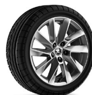
Jantes en alliage léger 6,5 J x 17" «Stratos», silber