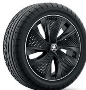
Jantes en alliage léger 6,5 J x 17" «Kajam Aero», noir avec panneau Aero noir