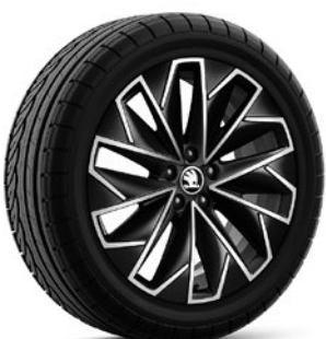
Jantes en alliage léger 6,5 J x 17" «Propus Aero», noir