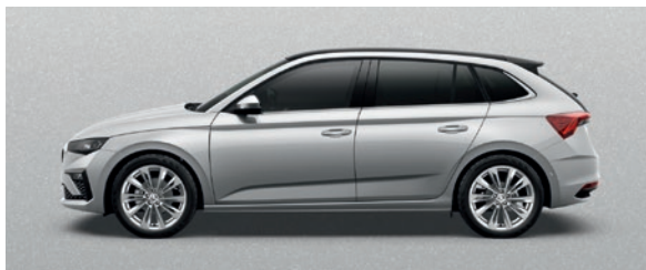
Métallisée Argent Brilliant