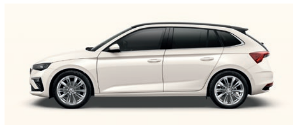
Uni Blanc Candy