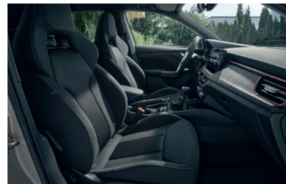
Design Selection Dynamic