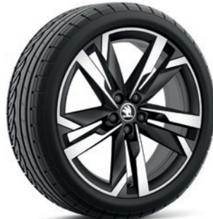
Jantes en alliage léger 7,0 J x 18" «Ursa», noir