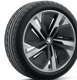
Jantes en alliage léger 7,0 J x 18" «Ursa Aero», argent avec panneau Aero noir

Les prix s'entendent en CHF et incluent 8.1% TVA. Certains des équipements optionnels mentionnés ci-dessus ne peuvent être commandés qu'en association avec d'autres équipements supplémentaires. De plus, lesdits équipements optionnels ne peuvent pas tous être combinés entre eux. Veuillez contacter votre partenaire Škoda pour de plus amples informations.