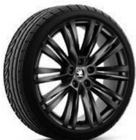
Jantes en alliage léger 8,0 J x 19" «Canopus» (Option pour Style et L&K, pneus 235/40 R19), noir