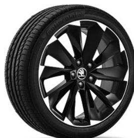
Jantes en alliage léger 8,0 J x 19" «Supernova» (Option pour Sportline, pneus 235/40 R19), noir avec surface polie