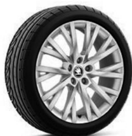
Jantes en alliage léger 8,0 J x 18" «Antares» (Option pour Ambition, Style und L&K, pneus 235/45 R18), argent