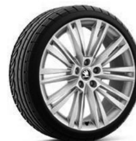
Jantes en alliage léger 8,0 J x 19" «Canopus» (Option pour Style et L&K, pneus 235/40 R19), argent