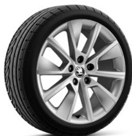
Jantes en alliage léger 8,5 J x 18" «Braga» (Serie pour Scout, Style und L&K, pneus 235/45 R18), argent