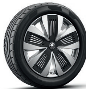
Cerchi in lega leggera 7,0 J x 19" «Talgar», argento con superficie lucidata e finiture aerodinamiche