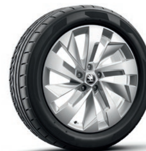
Cerchi in lega leggera 7,0 J x 19" «Rapeto», argento con superficie lucidata