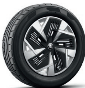
Cerchi in lega leggera 7,0 J x 18" «Mazeno», argento con superficie lucidata e finiture «Aero»