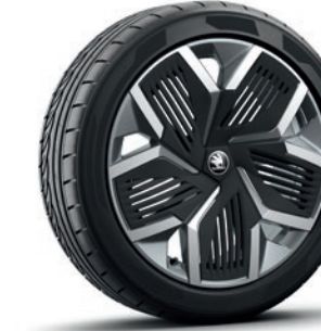
Cerchi in lega leggera 8,0 J x 20" «Rila», antracite con superficie lucidata e finiture aerodinamiche

I prezzi si intendono in franchi svizzeri incl. IVA dell'8.1%. Alcuni degli equipaggiamenti supplementari riportati in alto possono essere ordinati solo in abbinamento con altri equipaggiamento supplementari. Inoltre, non tutti gli equipaggiamenti supplementari elencati sono combinabili tra loro. Per informazioni particolareggiate la preghiamo di rivolgersi al suo partner Škoda.