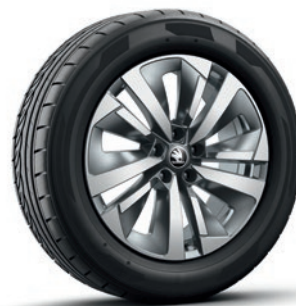
Cerchi in lega leggera 7,0 J x 18" «Soira», antracite con superficie lucidata