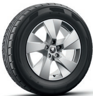
Cerchi in lega leggera 7,0 J x 17" «Paget», argento