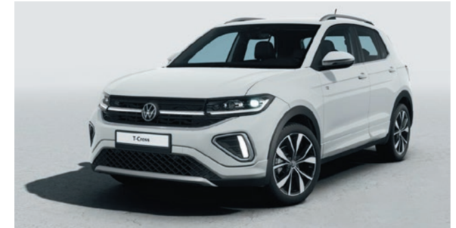
Pure White Uni-Lackierung