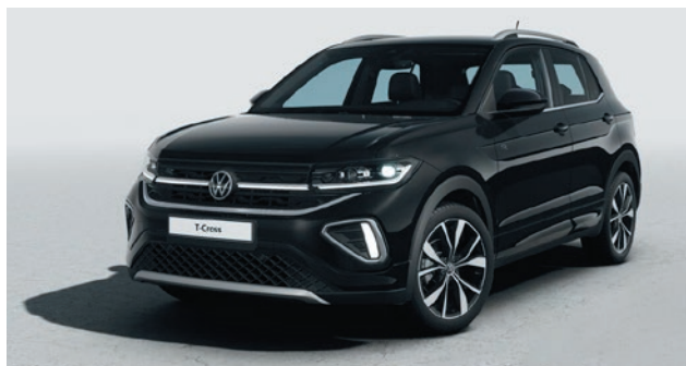
Deep Black Perleffekt-Lackierung