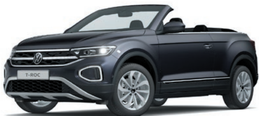
Smoky Grey peinture métallisée 5W