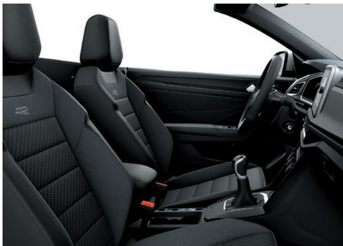
R-Line: Stoff / ArtVelours „R-Line“