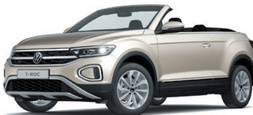
Ivory Silver peinture métallisée 6N