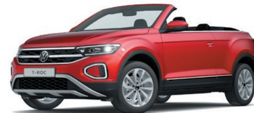
Kings Red peinture métallisée P8