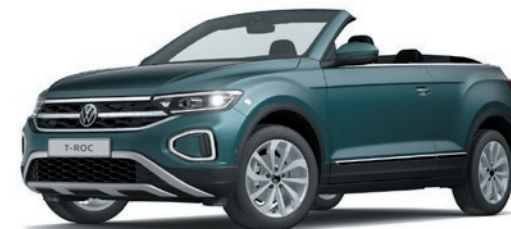
Petroleum Blue peinture métallisée Z3