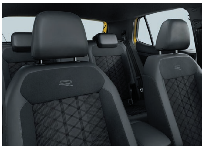
R-Line (di serie): sedili sportivi comfort in tessuto, grigio