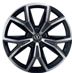
Cerchi in lega leggera «Köln»