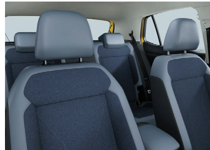
Style (di serie): sedili sportivi comfort in tessuto, Cosmicblue-nero titanio