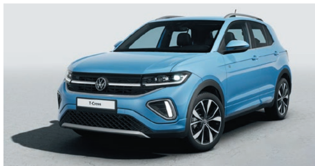
Clear Blue Verniciatura metallizzata