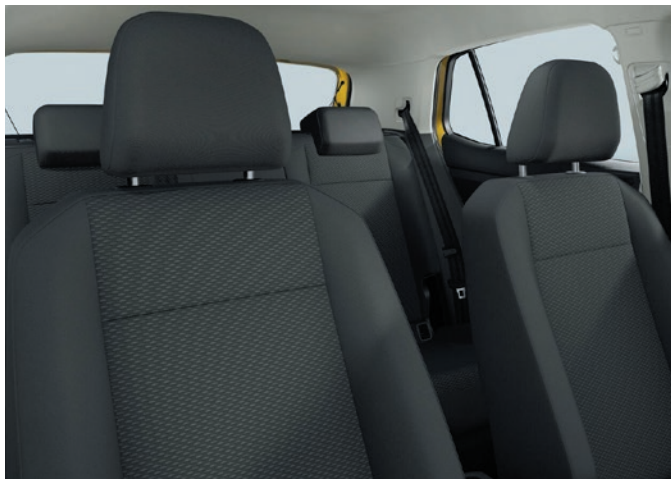
Base (di serie): tessuto, nero titanio