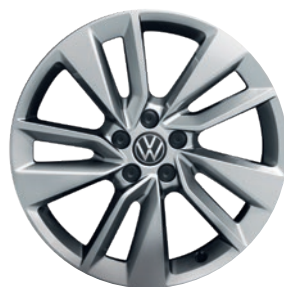
Cerchi in lega leggera «Bangalore»