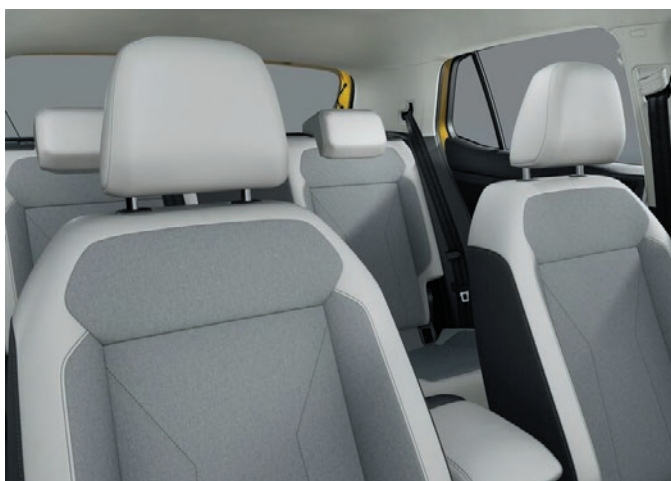
Style (opzione pacchetto design Style): sedili sportivi comfort in tessuto, «Mistral»