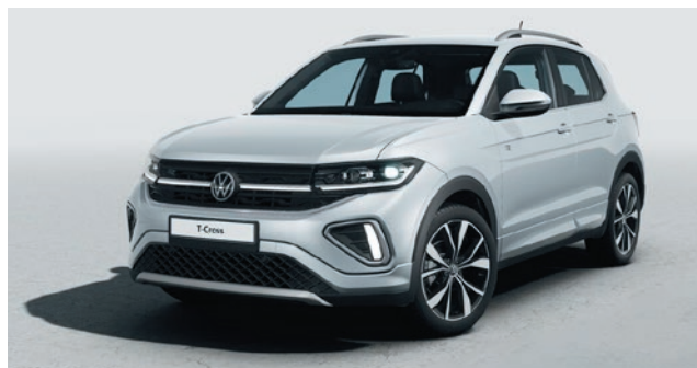
Argento riflesso Verniciatura metallizzata