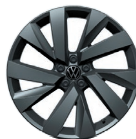
Cerchi in lega leggera «Funchal»