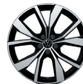
Cerchi in lega leggera «Misano»