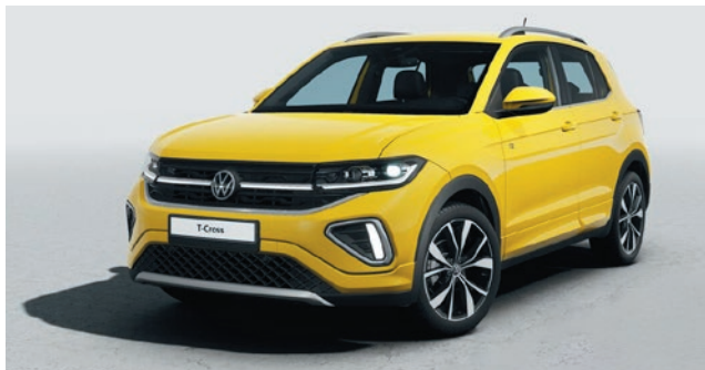
Grape Yellow Verniciatura tinta unita