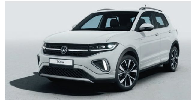
Pure White Verniciatura tinta unita