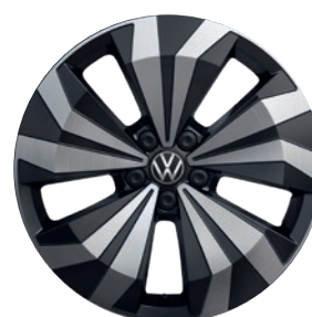
Cerchi in lega leggera «Manila»