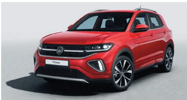
Kings Red Verniciatura metallizzata