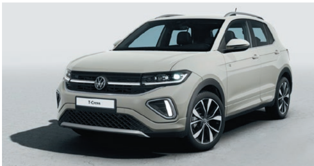
Ascot grigio Verniciatura tinta unita