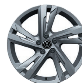
Cerchi in lega leggera «Valencia»