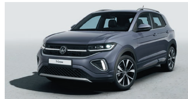
Grigio fumo Verniciatura metallizzata