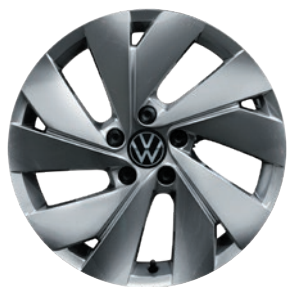
Cerchi in lega leggera «Nottingham»