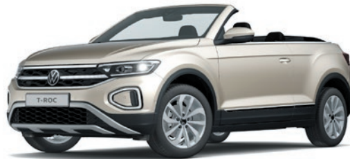
Ivory Silver verniciatura metallizzata 6N