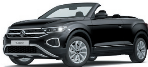
Deep Black verniciatura effetto perlato 2T