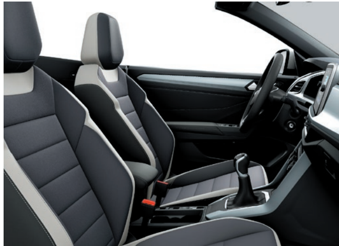
Style: Pelle „Vienna“ Grigio Platino / Ceramica