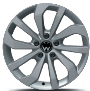
Cerchi in lega leggera «Johannesburg»