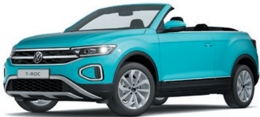
Teal Blue verniciatura tinta unita B2