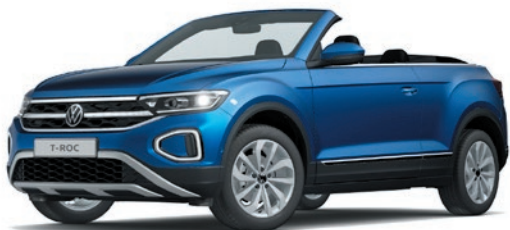
Ravenna Blue verniciatura metallizzata 5Z