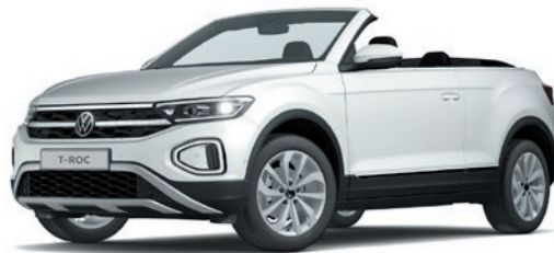
Pure White verniciatura tinta unita 0Q