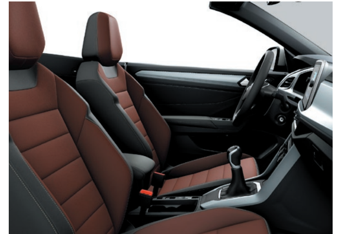
Style: Pelle „Vienna“ Marrakesch / Antracite