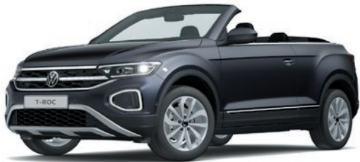
Smoky Grey verniciatura metallizzata 5W