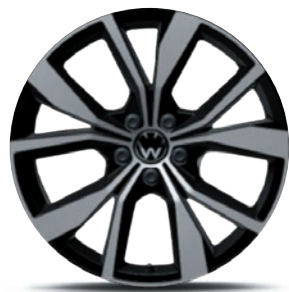
Cerchi in lega leggera «Misano»