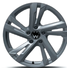
Cerchi in lega leggera «Valencia»