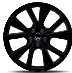
Cerchi in lega leggera «Misano»