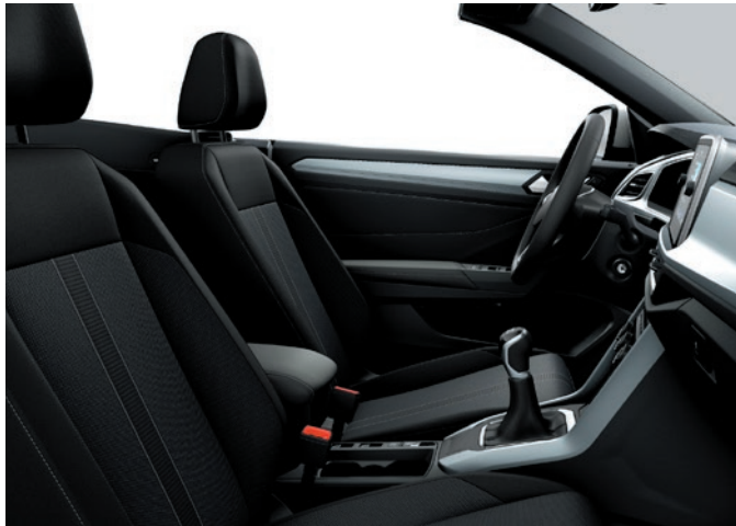
Style: Tessuto, Design „Style“ Nero titano-Ceramica