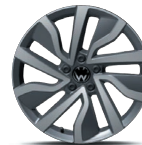
Cerchi in lega leggera «Portimao»