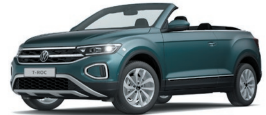
Petroleum Blue verniciatura metallizzata Z3