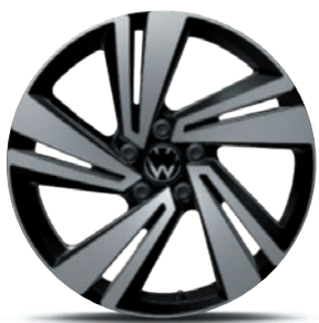
Cerchi in lega leggera «Nevada»