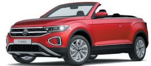
Kings Red verniciatura metallizzata P8